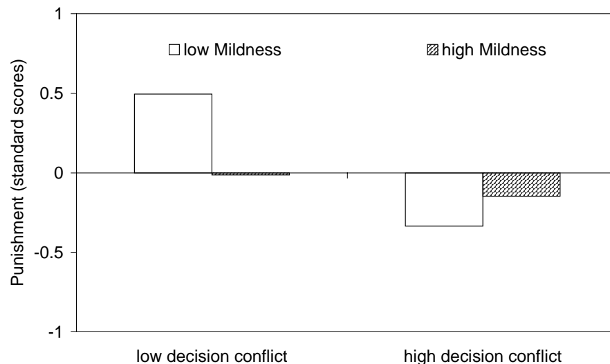
Figure 1: Interaction of decision conflict and mildness on punishment (insurance fraud; N = 137).